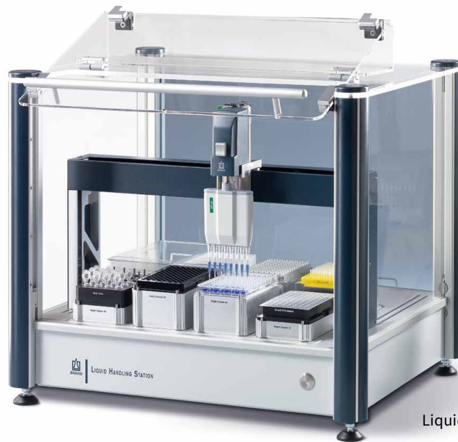
Liquid Handling Station